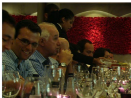
Jantar do Dioniso Clube de Vinhos, no Eñe, em São Paulo