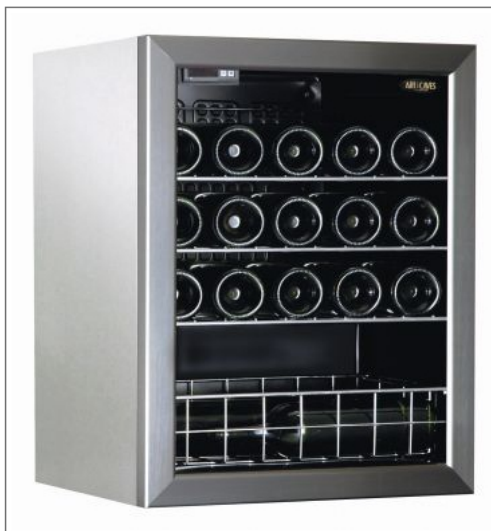
Adega Basic

Conheça mais sobre a Maison des Caves no site www.maisondescaves.com.br